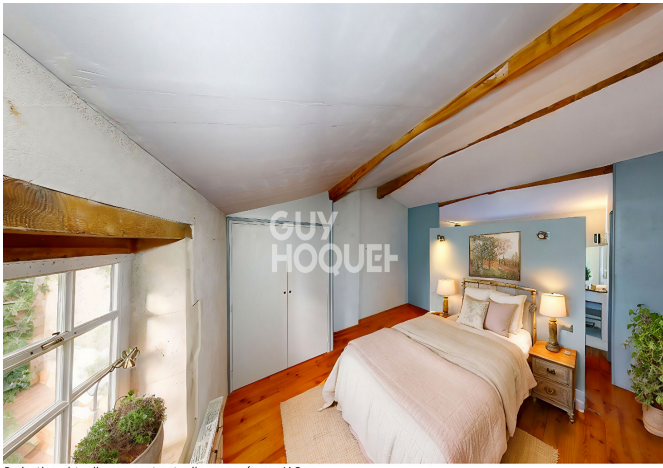
Projection virtuelle non contractuelle proposée par IACrea