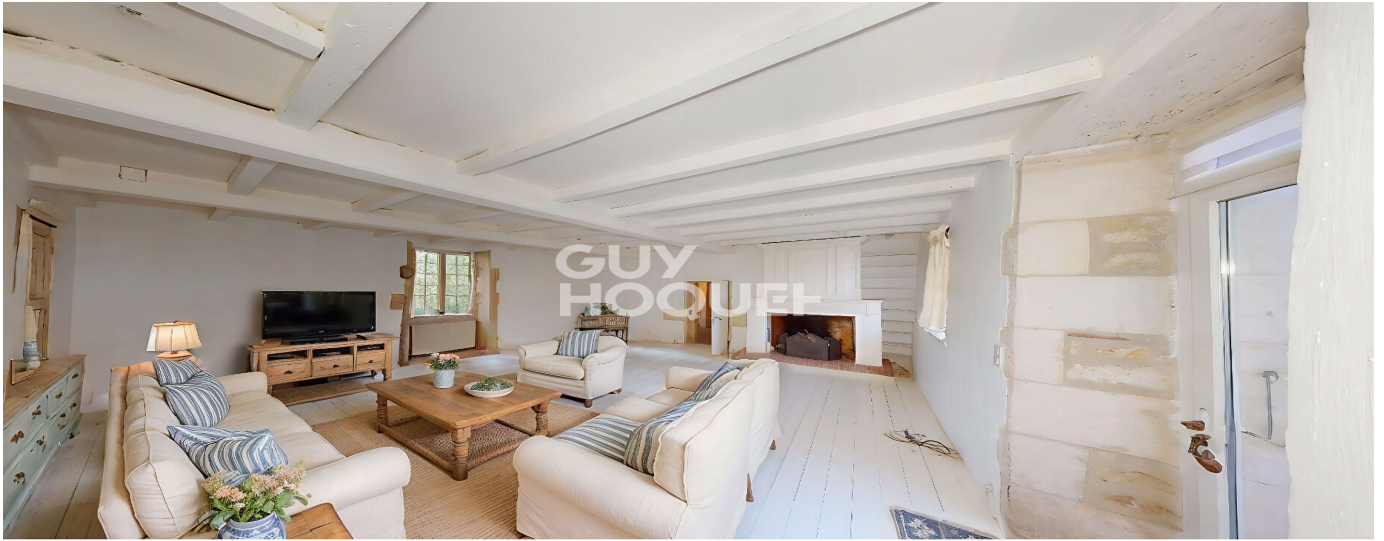
Projection virtuelle non contractuelle proposée par IACrea